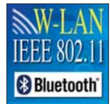
Optionaler kabelloser Anschluss mit LCD-Anzeige