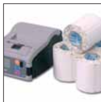
Langer Akkubetrieb durch neue Akkuzellentechnik