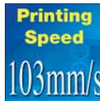
Der schnellste, mobile Drucker auf dem Markt