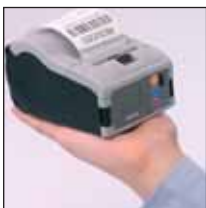
Robust und ergonomisch passt er genau in Ihre Hand